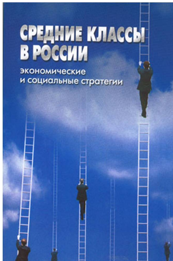
Малева и др., 2003