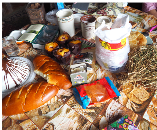
Женский ритуал из Ферганской долины. Москва. Автор Анна Цеслевская