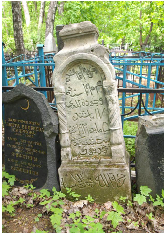
Надгробный памятник на Даниловском мусульманском кладбище. Москва. Автор: Марат Сафаров