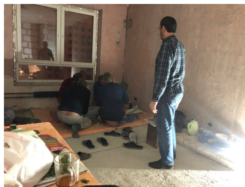
Изгнание джина. Москва.

Целью статьи является осветить сообщества мечетей в России на примере московских мечетей, которые часто посещают жители города, в том числе мигранты из Центральной Азии. Я буду использовать теоретическую основу Андерсона «воображаемого сообщества» при анализе материала, представленного в докладе. Основным аргументом является то, что нет реальных общин мечетей, а скорее, существует чувство общности, сформированное вокруг мечетей. Тем не менее, внутри и вокруг мечетей функционирует множество сетей, групп и учреждений. Статья основана на полевых работах, проведенных в 2016 и 2017 годах.