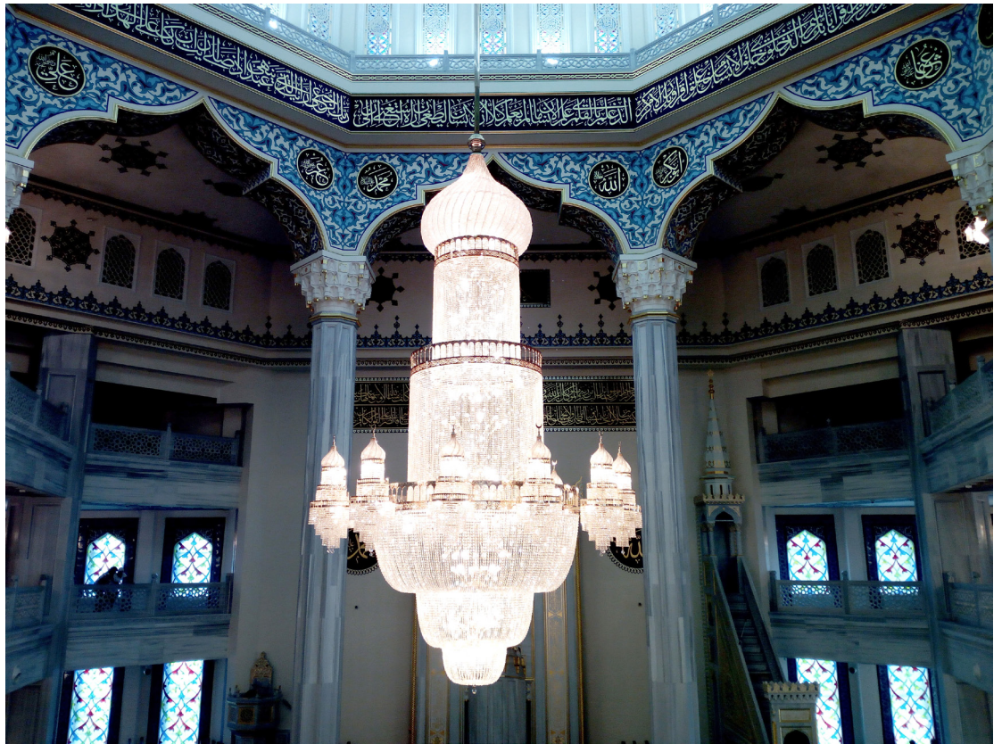
Московская соборная мечеть. Автор Марат Аршабаев

HEINRICH BÖLL STIFTUNG MOSCOW Russian Federation