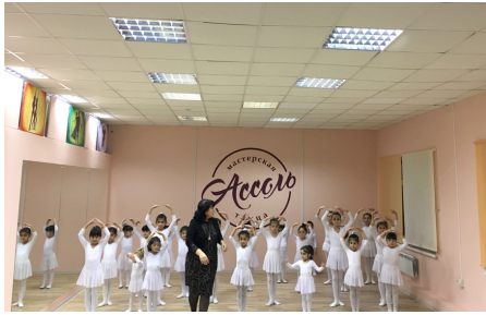
Детская танцевальная группа при памирской Региональной Общественной Организации «НУР», Москва.

избавления от нечистых духов. Докладчика интересует как объясняют сами информанты свой недуг, как их религиозная интерпретация своей беды коррелирует с их зачастую позитивистской позицией и медицинскими научными представлениями, в каком мусульманском, социальном, экономическом, культурном и правовом контекстах существуют муллы и их клиенты? Докладчика интересуют и механизмы данных мусульманских практик — как пациенты или их родственники находят мулл, сколько они им платят, если вообще платят, как они оценивают прогресс от проведения сеансов экзорцизма?