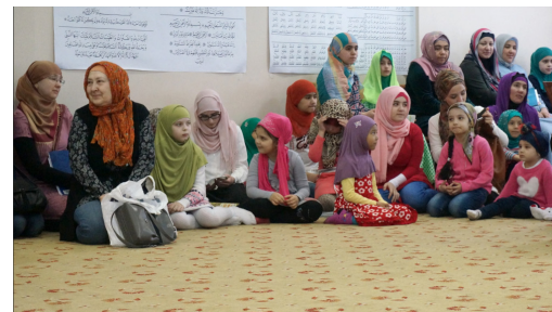
Мытищи, олимпиада по основам исламских знаний, 2017 г.

Что касается исмаилитского религиозного образования, то оно направлено на предотвращение радикализма, которое воспринимается как одна из величайших угроз для воспитанного в Москве, молодого поколения исмаилитов. Кроме того, в докладе рассматривается вопрос деятельности неофициальных религиозных лидеров (халифов).